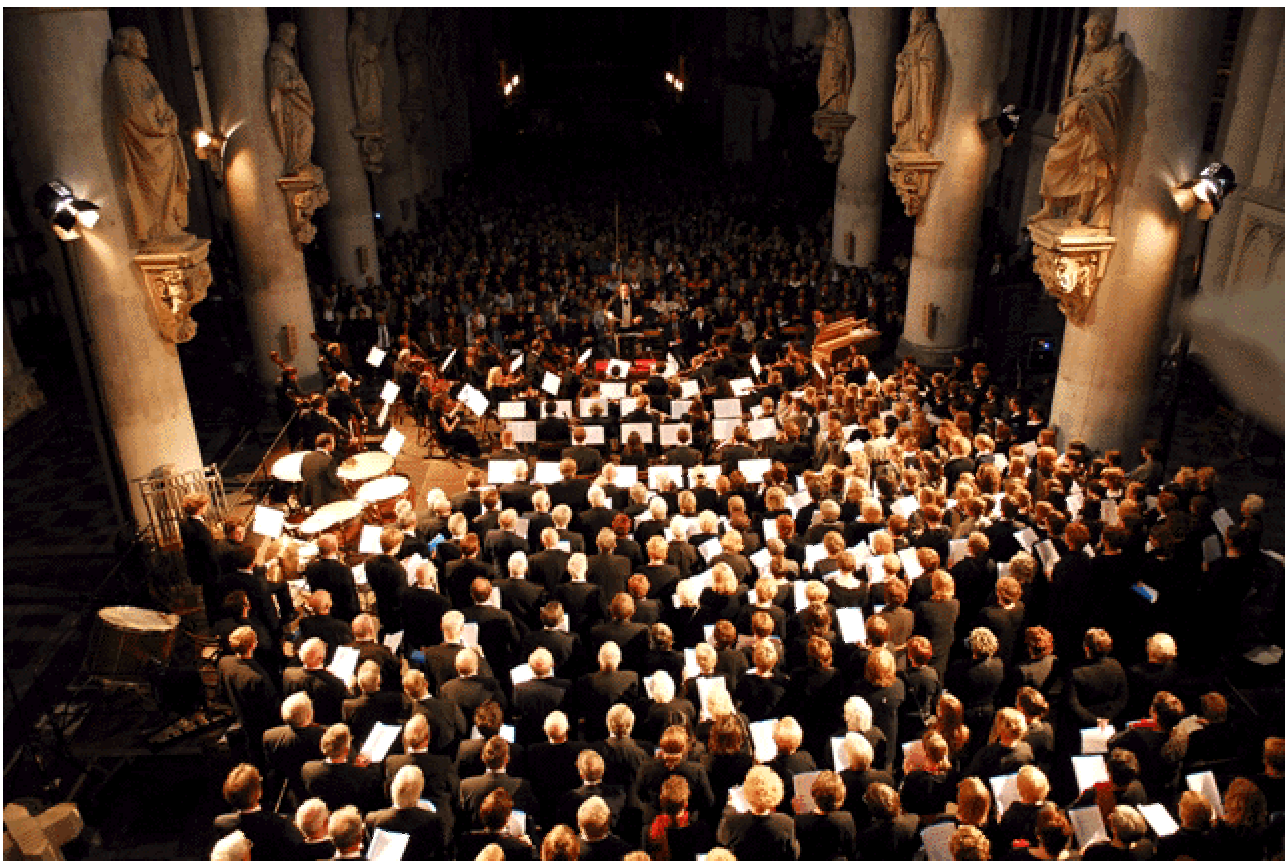
Brussels Philharmonic Orchestra – Kathedraal - Mechelen 12 oktober 2007

Geen enkel van zijn andere composities benadert de populariteit van Carmina Burana , met als beste bewijs O Fortuna , dat zonder ophouden wordt gespeeld en opgenomen. Voor de meeste mensen begint en eindigt de collectie werken van Orff met Carmina Burana .